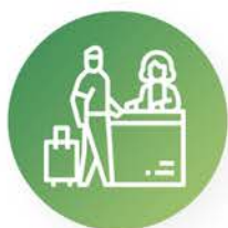
Gestión telefónica y recepción