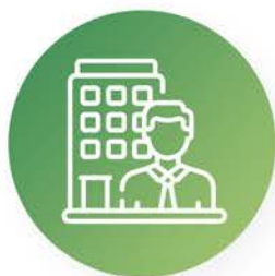
Edificios y oficinas

Contamos con un equipo de profesionales especializados en cada uno de los sectores en los que trabajamos. Queremos contribuir a la consecución de los objetivos de tu empresa.