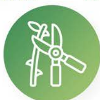
Arboricultura, poda de árboles