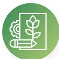
Diseño y construcción de espacios verdes