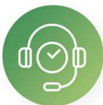
Atención e información al usuario