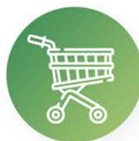
Recogida de carros