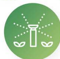
Instalaciones de redes de riego