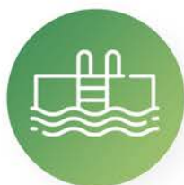
Gestión integral de instalaciones

Nuestra filosofía es ser uno más en tu empresa, queremos ser algo más que proveedores de servicios, queremos ser tu socio en el día a día, nos preocupamos por conocer tus valores y adaptarnos a tus procedimientos de trabajo. Tenemos a tu disposición todos estos servicios: