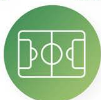
Mantenimiento de instalaciones deportivas