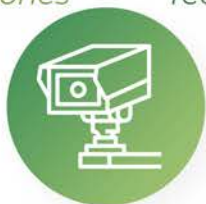
Control de accesos