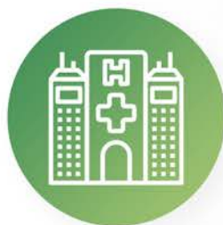
Hospitales y centros médicos