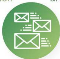
Distribución de correo interno