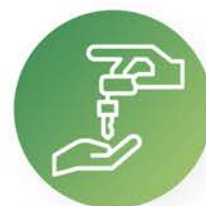
Conserjería y portería