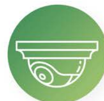
Videovigilancia y CCTV