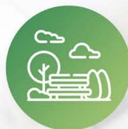
Zonas verdes y parques