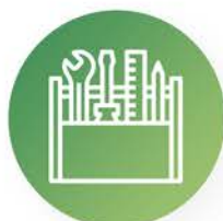
Carpintería, pintura, albañilería