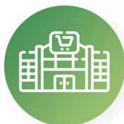
Grandes superficies y cadenas de distribución