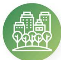
Jardinería urbana: parques, viales y urbanizaciones