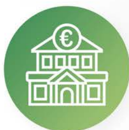
Entidades bancarias y aseguradoras